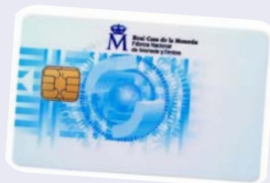
Certificado digital FNMT

https://www.sede.fnmt.gob.es/certificados