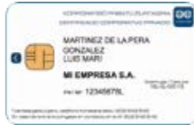
Korporatiboen ziurtagiri profesionala