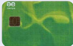
Certificado digital ciudadano

Una vez conectado el lector de tarjeta USB y la tarjeta Izenpe, su equipo reconocerá su certificado y solicitará que introduzca el PIN de la tarjeta. Su dispositivo identificará su certificado y podrá realizar cualquier gestión o trámite administrativo, de manera sencilla.