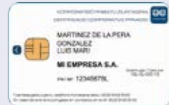
Certificado profesional corporativo