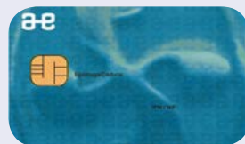
Certificado digital de representante de entidad y entidad sin personalidad jurídica