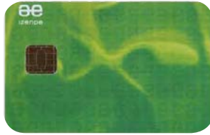
Herritarren ziurtagiri digitala

izapide administratibo burutu ahal izango dozu erraz.