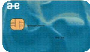
Erakunde eta izaera juridikorik gabeko erakunde ordezkarien ziurtagiri digitala