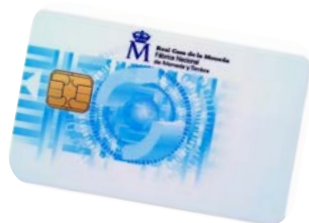
FNMT ziurtagiri digitala

https://www.sede.fnmt.gob.es/certificados