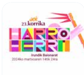
Badator 23. Korrika!