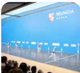
Urrezko Pala Pro Txapelketako finala