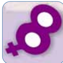
EMAKUMEEN NAZIOARTEKO EGUNA