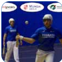
MUNDUKO PALA TXAPELKETA